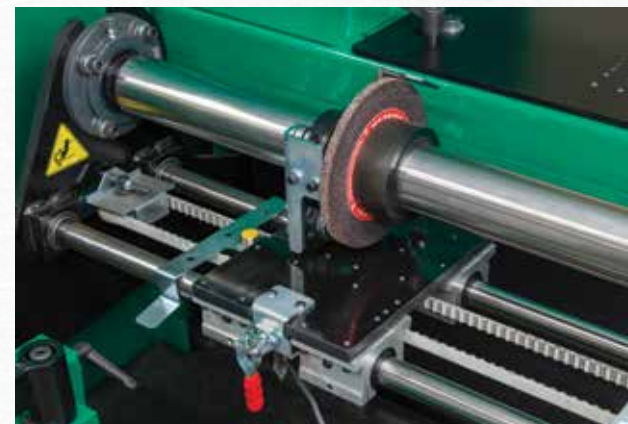
Gruppo di Spoglia con Auto-Index, fornisce un gruppo per la rettifica a spoglia facilmente collegabile che permette l'indexaggio lama a lama "hands-free".