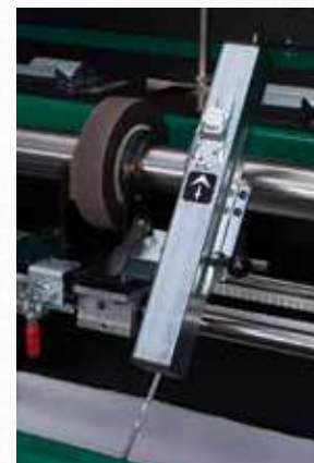
Calibro "ACCU-Positioning", è facilmente montabile sul carrello, consentendo l'allineamento della mola per rimuovere il cilindro conico.