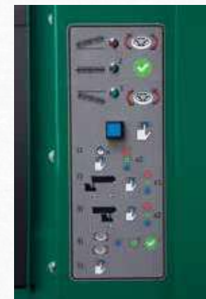
Luci a LED, permettono anche all'operatore più inesperto la lavorazione in caso di cilindro conico e una perfetta rettifica cilindrica ogni volta.