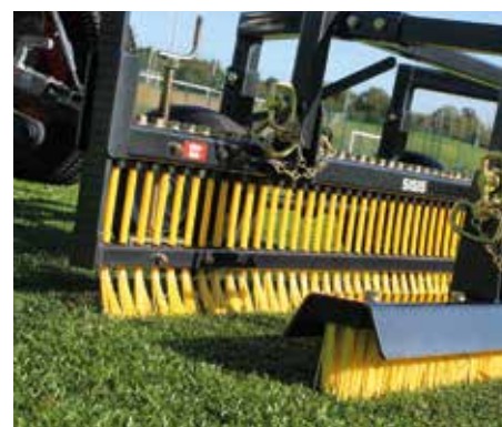
Struttura trainata con la spazzola flexicomb e dritta. La traversa è bassa per irrigidire le setole per l'intaso con gomma