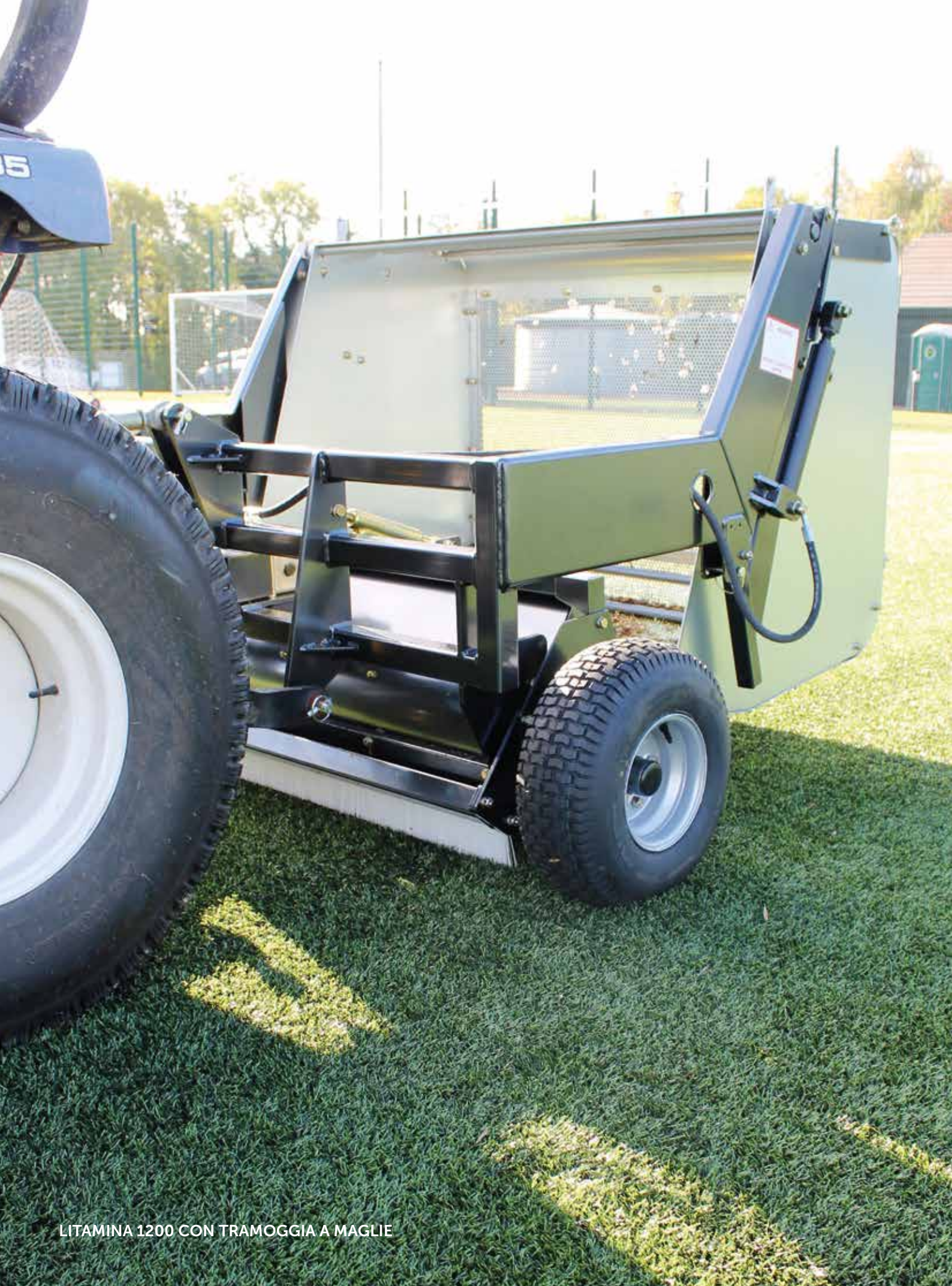
LITAMINA 1200 CON TRAMOGGIA A MAGLIE