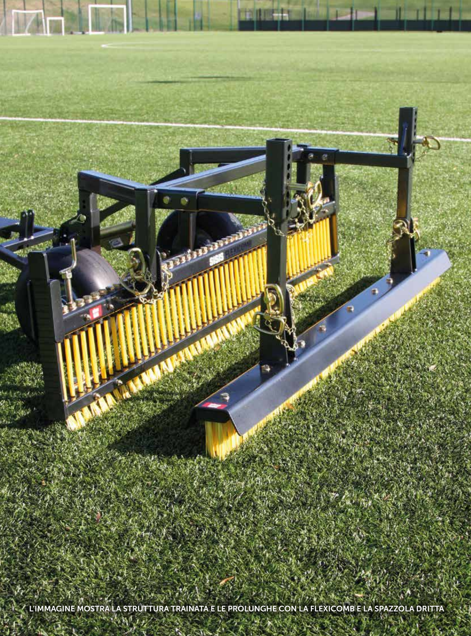
L'IMMAGINE MOSTRA LA STRUTTURA TRAINATA E LE PROLUNGHE CON LA FLEXICOMB E LA SPAZZOLA DRITTA