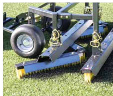
Zig Zag e la combinazione di spazzole ideale per riempimento con palline di gomma o sabbia