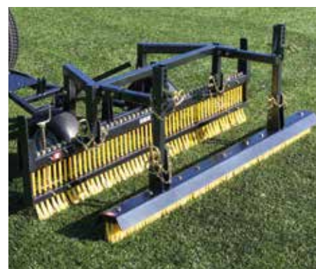
Combinazione Flexicomb e spazzola ideale per riempimento con palline di gomma o sabbia