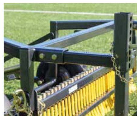
I doppi bracci di estensione consentono l'aggiunta di una spazzola aggiuntiva

SPECIFICHE DISPONIBILI SUL SITO: www.synprobysis.com