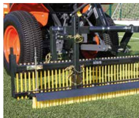
Setole più rigide – Traversa della Flexicomb impostata bassa per intaso con scarti di gomma