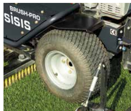
Pneumatici posteriori scolpiti con pneumatici lisci opzionali