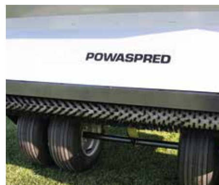
La spazzola in rotazione a livello del punto di scarico garantisce una distribuzione uniforme.

SPECIFICHE DISPONIBILI SUL SITO: www.synprobysis.com