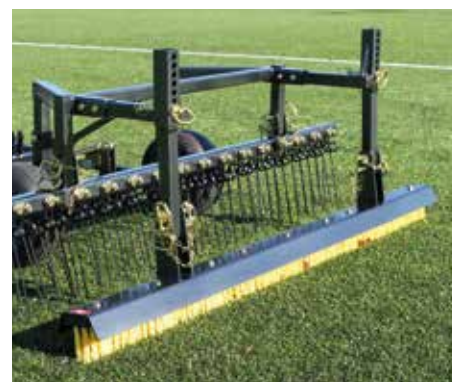
Struttura trainata con flexicomb e spazzola dritta in azione sull'intaso con sabbia.