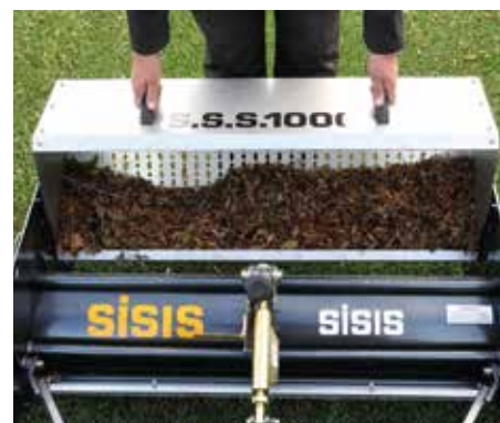
Facile rimozione della tramoggia e dei detriti indesiderati.