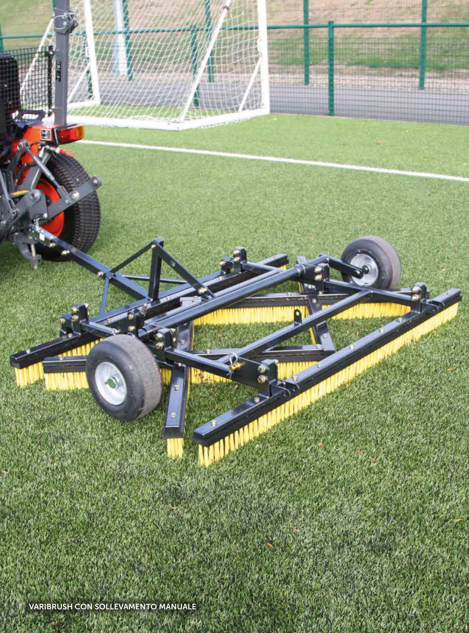
VARIBRUSH CON SOLLEVAMENTO MANUALE