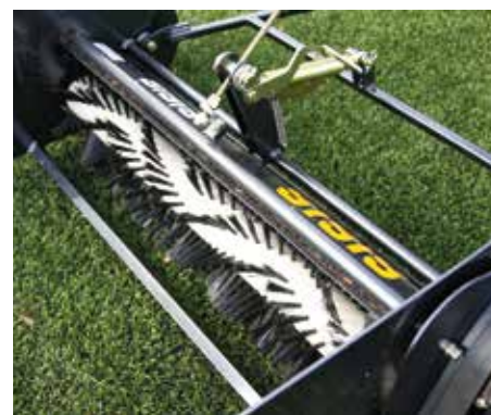
L'altezza della spazzola è facilmente regolabile senza utensili.