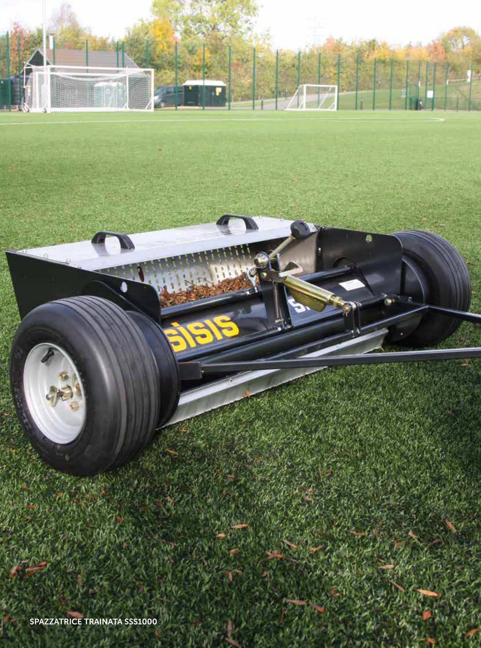
SPAZZATRICE TRAINATA SSS1000