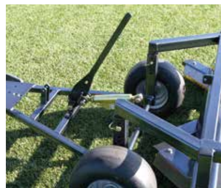
Telaio trainato con sollevamento manuale