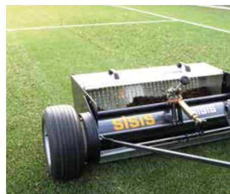
La spazzatrice in azione lasciando al suo passaggio una superficie pulita.

SPECIFICHE DISPONIBILI SUL SITO: www.synprobysis.com