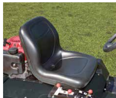
Sedile molto confortevole e sterzo e comandi di facile uso per l'operatore