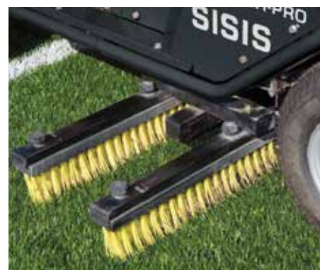
Le spazzole oscillanti in azione.