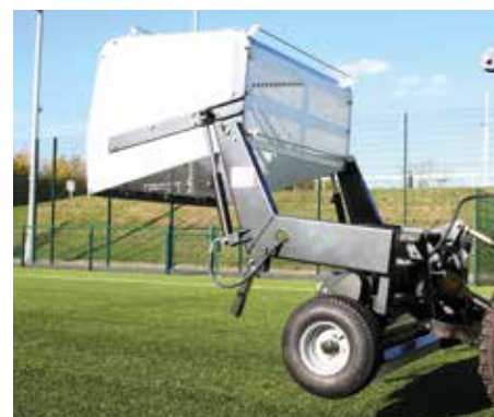
Struttura idraulica per il rovesciamento per svuotare facilmente la tramoggia