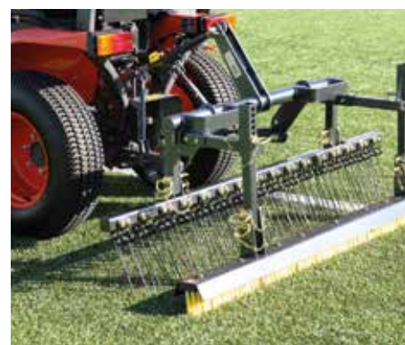
Struttura twinplay con flexicomb e spazzola dritta in azione sull'intaso con gomma.