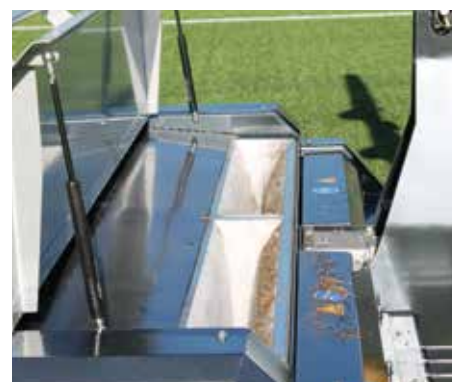
Facile di rimozione delle sezioni di filtro che contengono particelle fini di polvere