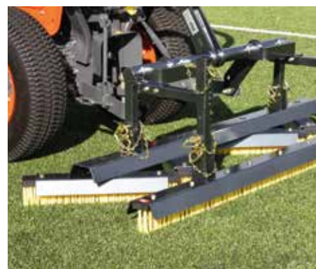
Combinazione di spazzola a zig-zag e spazzola dritta al lavoro su intaso con sabbia