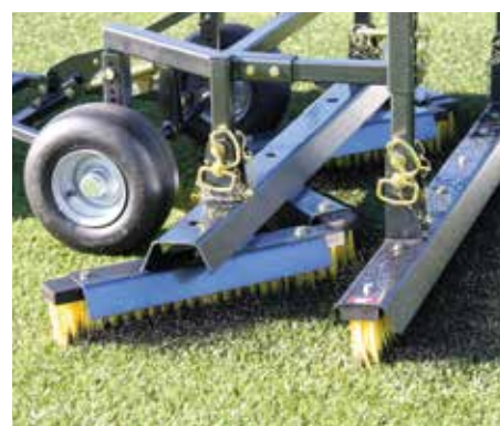
I doppi bracci di estensione consentono l'aggiunta di una spazzola aggiuntiva