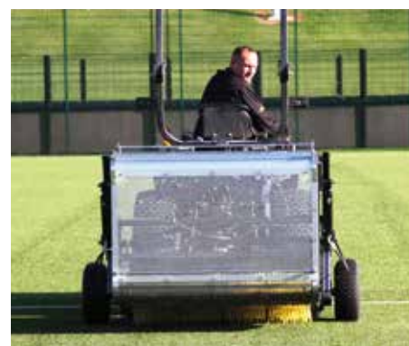
La spazzatrice durante la raccolta dei detriti e migliorando l'aspetto del campo