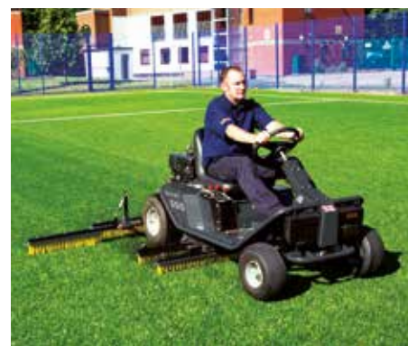
Copertura rapida ed efficace