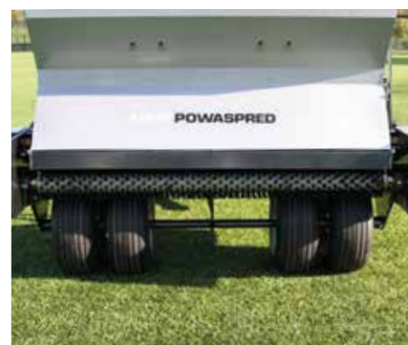
L'assale a quattro ruote contribuisce a un peso uniforme