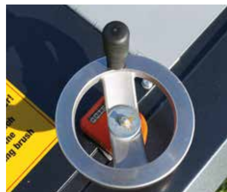
Manopola di facile utilizzo per la regolazione della profondità di lavoro