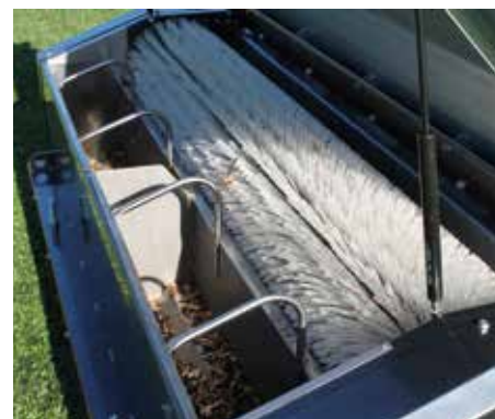
Sezioni removibili per i detriti

SPECIFICHE DISPONIBILI SUL SITO: www.synprobysis.com