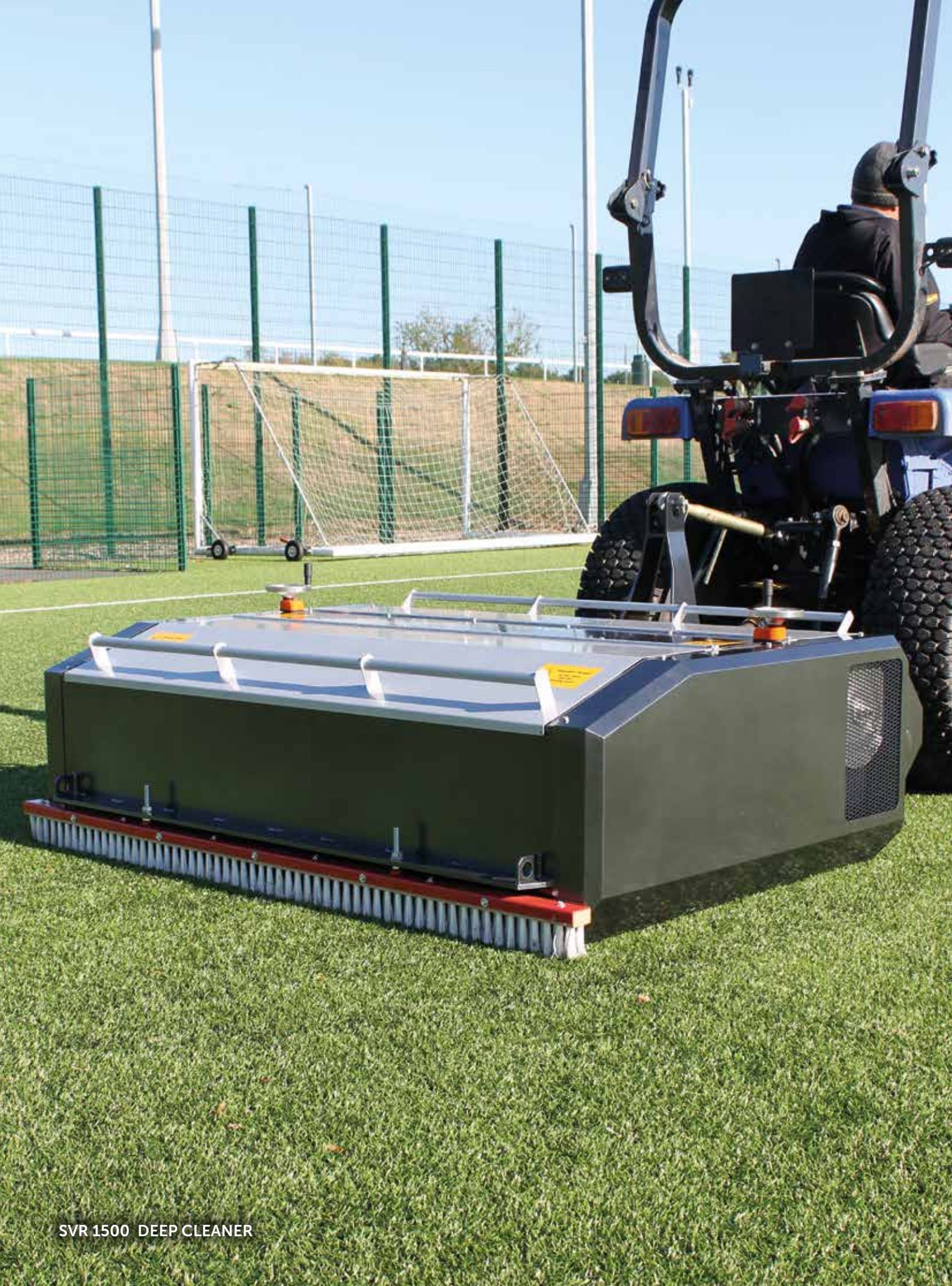
SVR 1500 DEEP CLEANER