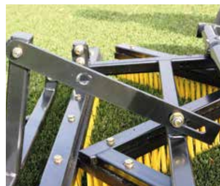
Barra di traino regolabile per altezza di traino