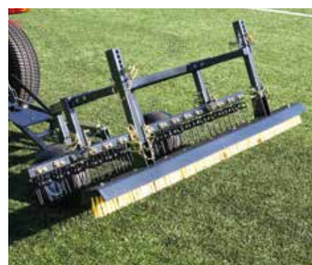
Telaio trainato in posizione di trasporto