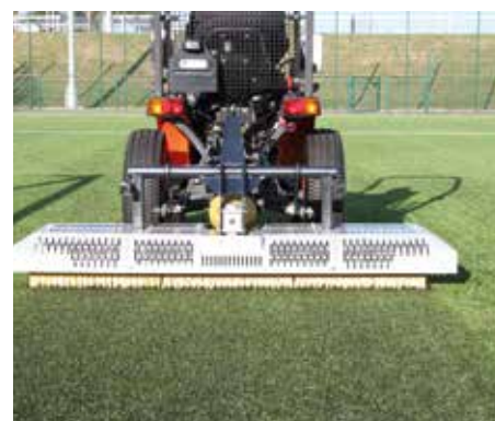
In azione, raddrizzando i peli e muovendo l'intaso.

SPECIFICHE DISPONIBILI SUL SITO: www.synprobysis.com