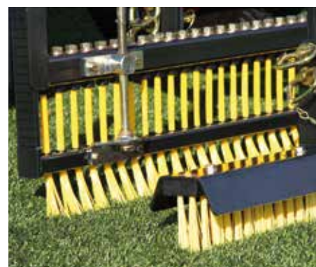
Struttura twinplay con rastrello per la pettinatura fine e spazzola dritta in azione riducendo la compattazione sull'intaso con gomma.

SPECIFICHE DISPONIBILI SUL SITO: www.synprobyssis.com