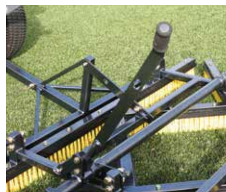
In azione, raddrizzando i peli e muovendo l'intaso.