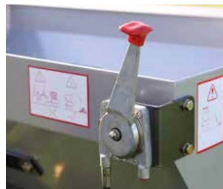
Comando a cavo per l'interruzione del materiale