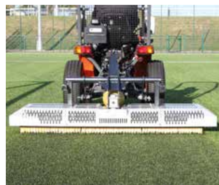
In azione durante il processo di spazzolatura e permettendo la finitura finale

SPECIFICHE DISPONIBILI SUL SITO: www.synprobysis.com