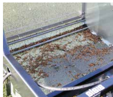
Detriti raccolti e nessuna traccia di intaso