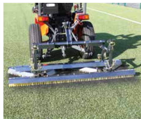
Combinazione di spazzola a zig-zag e spazzola dritta al lavoro su intaso con scarti di gomma