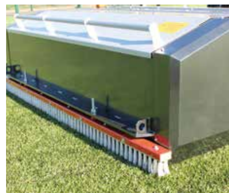
Spazzola posteriore per la stesura