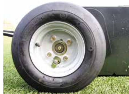
Per disinserire la trasmissione della ruota verso la spazzola durante il trasporto è sufficiente "tirare e ruotare" le leve della frizione su ciascuna ruota.